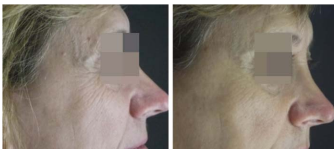
FIGURA 5: Pré e pós-aplicação: observar a melhora do melasma