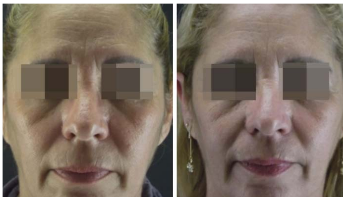
Figura 6: Pré e pós-aplicação: observar a melhora das rugas e do brilho

pia) do composto ficou bastante satisfeita com o tratamento. Um dado que chamou a atenção foi que várias pacientes portadoras de melasma relataram sua melhora com o tratamento.