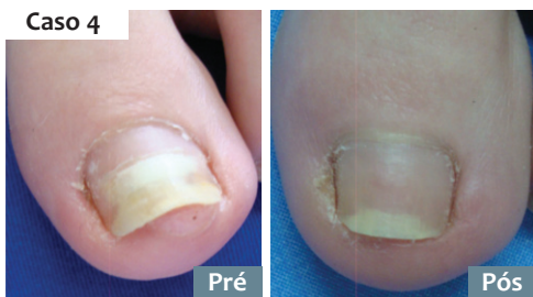
FIGURA 2: Evolução após 9 meses dos pacientes 4 e 5.