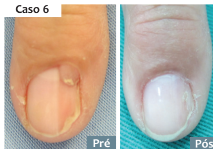
FIGURA 3: Evolução após 9 meses dos pacientes 6 e 7

O acompanhamento pós-operatório é de importância fundamental no sucesso da cirurgia. Dependendo do procedimento utilizado, este período pode ser de tempo variado e apresentar complicações que o médico deve saber manejar. Nestes cursos a evolução dos pacientes operados não é conhecida tornando-se uma lacuna no aprendizado completo dos alunos.