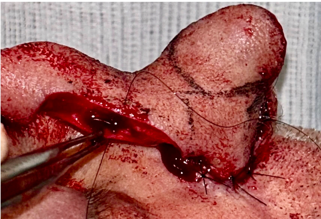
FIGURA 2: Ponto simples interrompido unindo as porções superior (pele) e inferior (fáscia) do pedículo