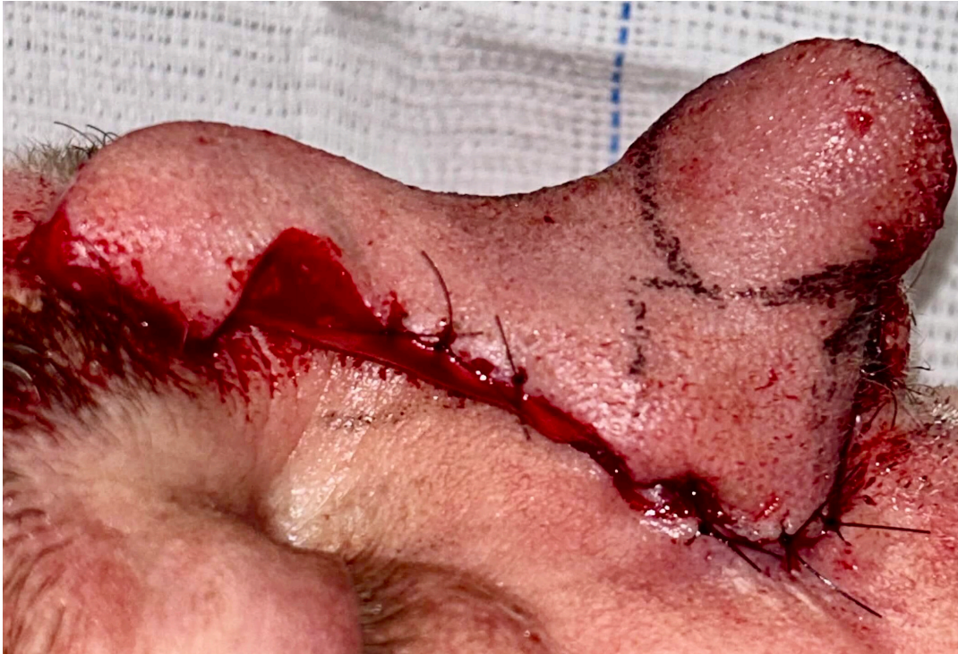
FIGURA 3: Sutura reduzindo a área cruenta e minimizando o risco de sangramento