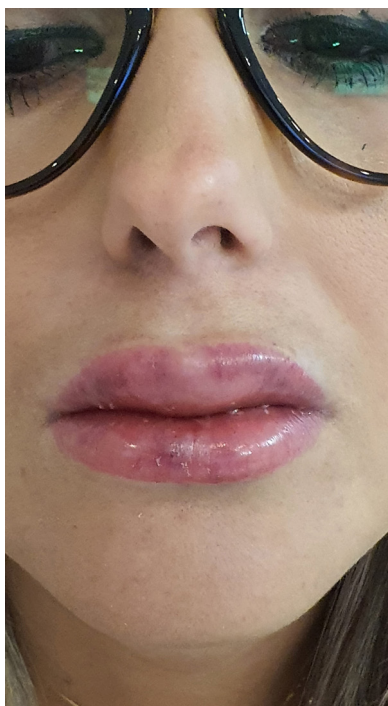
FIGURA 1: Aspecto edematoso, com equimoses nos lábios

As complicações são classificadas em precoces (que se relacionam à infiltração, como edema, dor, equimose, sangramento,