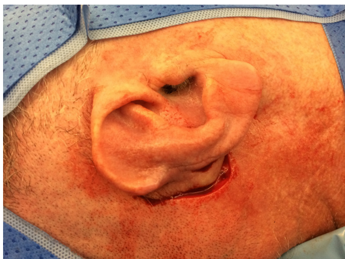
FIGURA 4: Reabordagem após 21 dias e liberação do pedículo