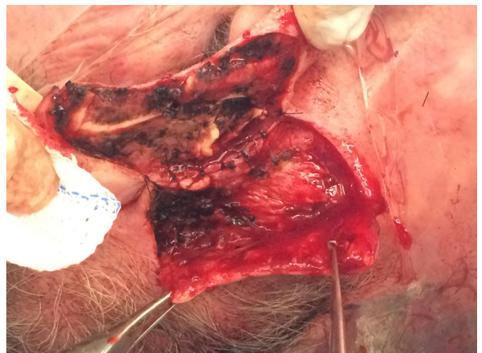
FIGURA 2: Ressecção da lesão, incluindo toda a espessura da pele, o pericôndrio e a cartilagem acometida. Elevação do retalho retroauricular e síntese da ilha de pele no sulco retroauricular

não melanoma”; são as neoplasias mais incidentes, possuindo valores ainda em ascensão. Sexo masculino e idade avançada são fatores de risco independentes para o desenvolvimento do CBC. A exposição intensa e intermitente à radiação solar está associada ao desenvolvimento de CBC devido à mutagênese causada pela radiação ultravioleta, sendo essa exacerbada em indivíduos com pele clara, cabelos ruivos ou loiros e olhos claros. 3,7,8,17,18,19