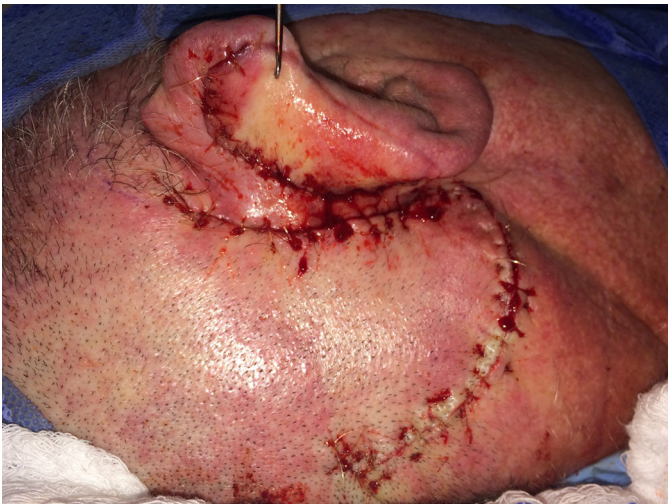
FIGURA 7: Aspecto imediato da reconstrução