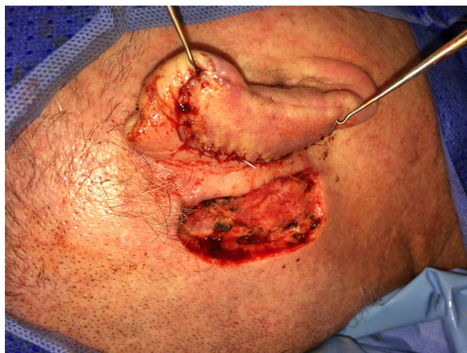
FIGURA 5: Fechamento completo do defeito primário e exposição da área doadora