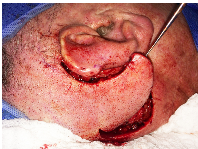
FIGURA 6: Retalho de rotação para fechamento da área doadora

Algumas lesões podem exibir mais de um padrão histopatológico, sendo as formas nodular e micronodular as mais comuns. Os subtipos morfeiforme e infiltrativo, bem como lesões com alterações histopatológicas micronodulares ou basoescamosas, são variantes mais agressivas. 3,7,17,18