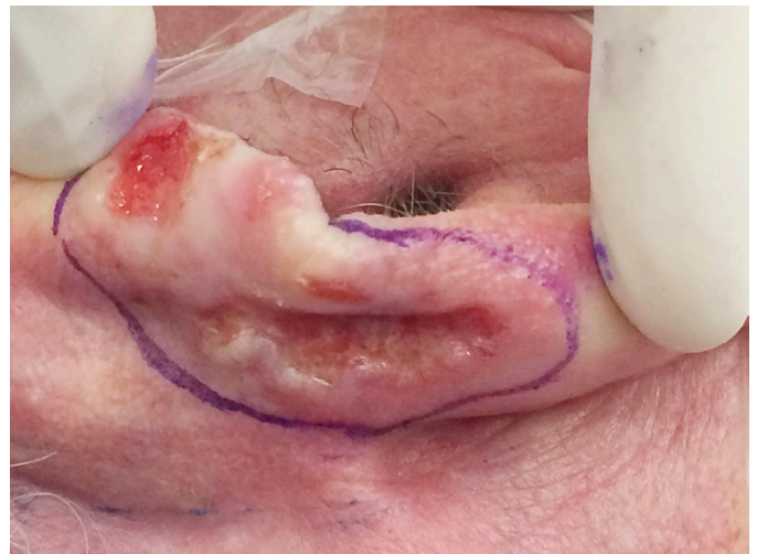
FIGURA 1: Avaliação pré-operatória e demarcação da margem de segurança

O carcinoma basocelular e o espinocelular são neoplasias malignas de queratinócitos, denominadas “câncer de pele