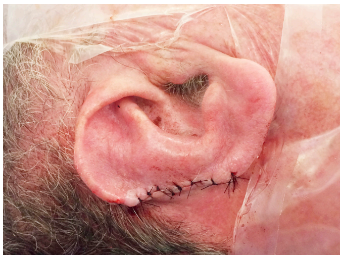
FIGURA 3: Sutura do retalho de interpolação na área cruenta da borda lateral da hélice da orelha