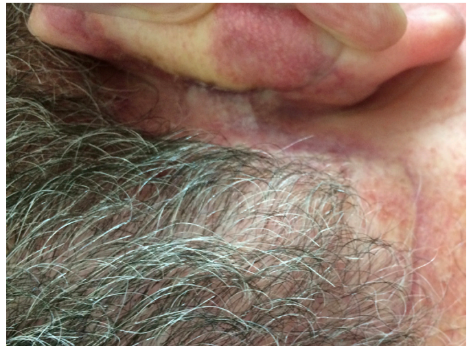
FIGURA 8: Aspecto tardio da reconstrução

área doadora da região posterior da orelha é escondida e conta, majoritariamente, com boa cicatrização. 11,12,22,24,25