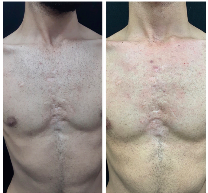
FIGURA 3: Cicatrizes em boxcar e rolling alargadas na região pré-esternal, antes e sete meses após o tratamento, com melhora parcial das cicatrizes atróficas

O paciente foi tratado com sessões de infiltração intraleisional semanais por três meses. Segundo os trabalhos de Amroliwalla 6 e Kalil-Gaspar 7 , que mantinham a terapia com frequência diária e por um tempo médio de 90 dias, estaria indicada a continuidade por maior período, porém o paciente era universitário e estaria impedido de frequentar o ambulatório nos próximos meses por motivos acadêmicos. Após sete meses (livre de tratamento), embora haja grande dificuldade de documentação fotográfica (bidimensional) de cicatrizes atróficas normocrômicas, o paciente e as médicas assistentes observaram melhora objetiva das lesões. A manutenção dos resultados, sem a lipofrafia de longo prazo que era produzida pela insulina no passado, pode ser explicada pela utilização de formas mais puras de insulina atualmente.