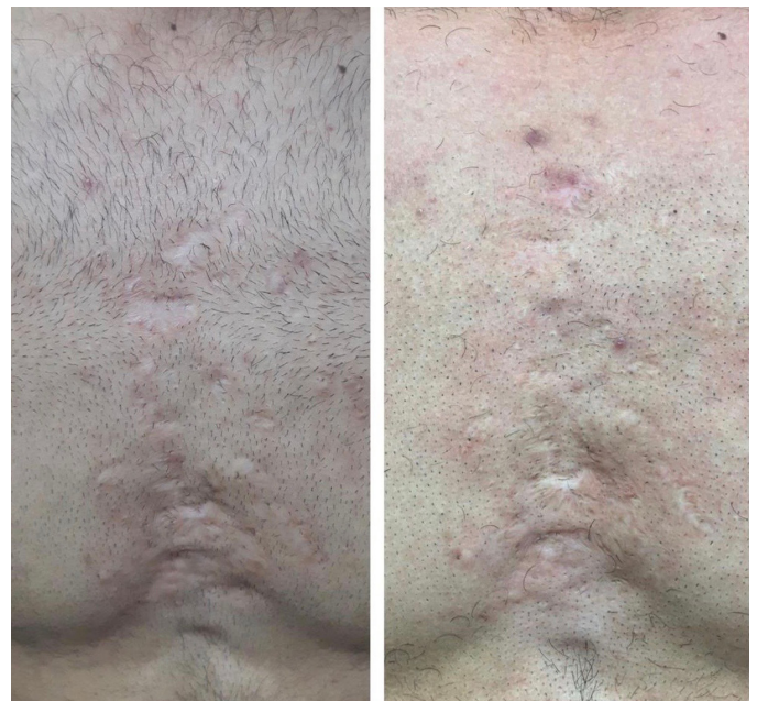
FIGURA 4: Cicatrizes da região pré-esternal mais aproximadas, antes e após o tratamento