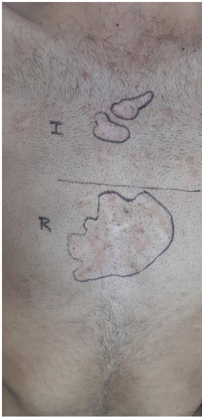
FIGURA 2: Marcação inicial em duas partes: superior (I) e inferior (R) (que seriam tratadas de formas distintas)

anticicatriz, utilizando pacientes submetidas a operações estéticas mamárias bilaterais. Observaram que as injeções subcutâneas nas cicatrizes reduziram a aparência destas comparadas com o placebo, mas sugerem que as propriedades da insulina em redução de cicatrizes são mais eficazes em indivíduos que estão sob risco de cicatrizes excessivas ou patológicas. 8