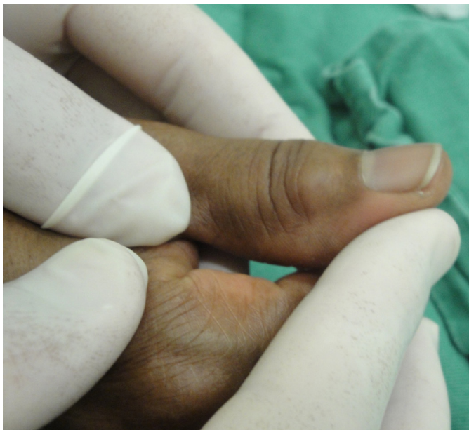
FIGURA 1: Avaliar o diâmetro do cisto para a escolha do tamanho da borracha do êmbolo da seringa a ser utilizada

O segredo para o sucesso do método é explicar ao paciente que este “curativo” deve persistir por, no mínimo, 15 dias, pois isto dará tempo para as paredes do cisto, assim unidas, “cicatrizarem-se” levando ao colapso definitivo de ambas, evitando a recidiva do mesmo (Figura 4).