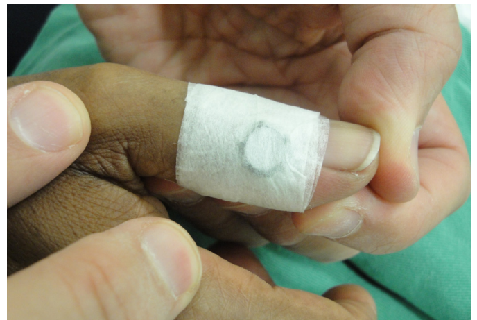
FIGURA 3: Fita de micropore fixando e comprimindo as paredes do cisto uma à outra