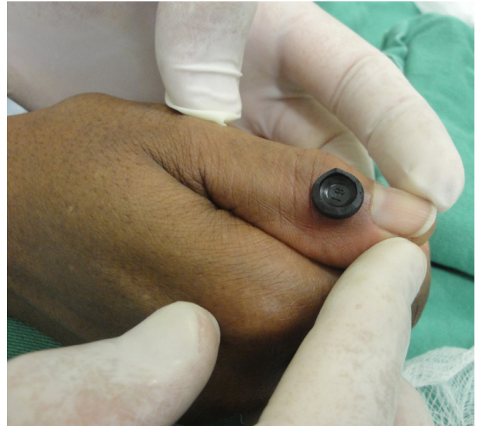
FIGURA 2: Borracha encaixada no leito do cisto já esvaziado

A borracha deve ser encaixada no leito criado do cisto (Figura 2), após o seu esvaziamento e com o auxílio de fita micropore fixa por compressão, assim colabando as paredes do cisto uma à outra (Figura 3).