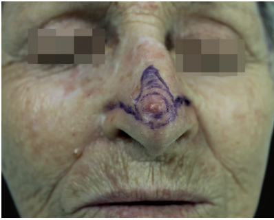
FIGURA 1: Marcação de lesão com margens de 3mm e desenho de retalho A-T