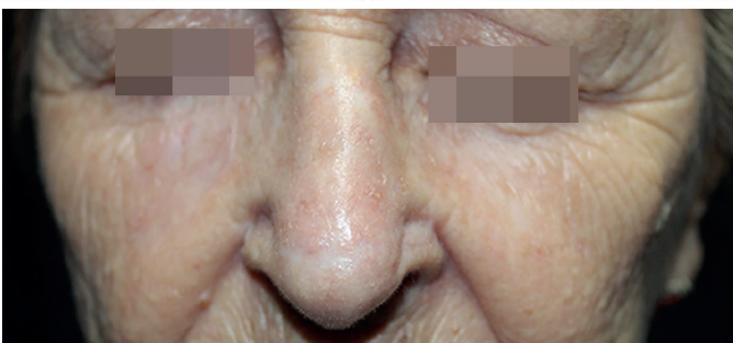
FIGURA 4: Aspecto do retalho A-T em ponta nasal após 6 meses